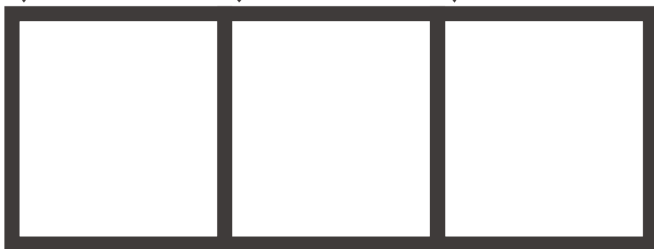
スタンプポイント MAP