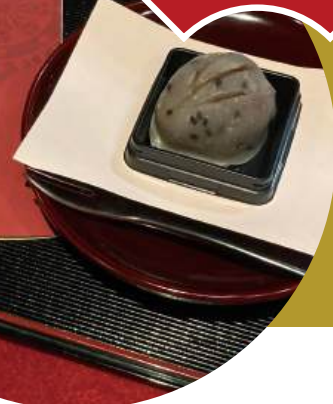
「亥の子餅」 上野摩利支天の